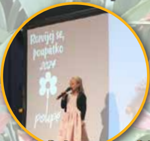
Rozvíjej se poupatko po dvaadvacáté str. 4