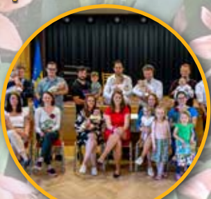
Vítání občánků v Třanovicích str. 10