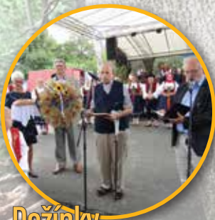
Dožínky v H. Tošanovicích str. 2