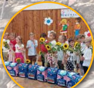
Zagajenie roku szkolnego str. 10