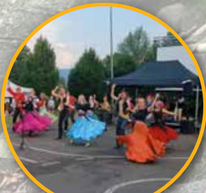
Střítežské léto po dvou letech str. 4