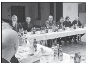
Mikroregion bude spolupracovat se Srby.