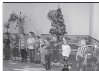
Návštěva v domě pro seniory.