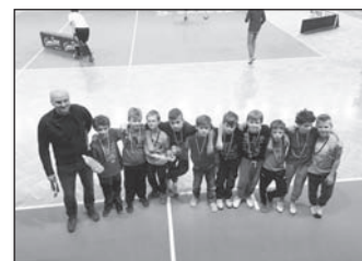
Třetí místo třanovických florbalistů.