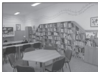
Školní knihovna v novém.